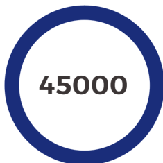
العائد الاقتصادي (ريال)