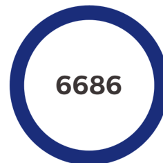
إجمالي الساعات التطوعية